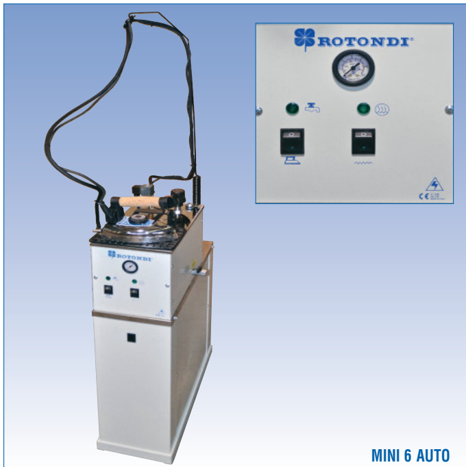
MINI 6 AUTO