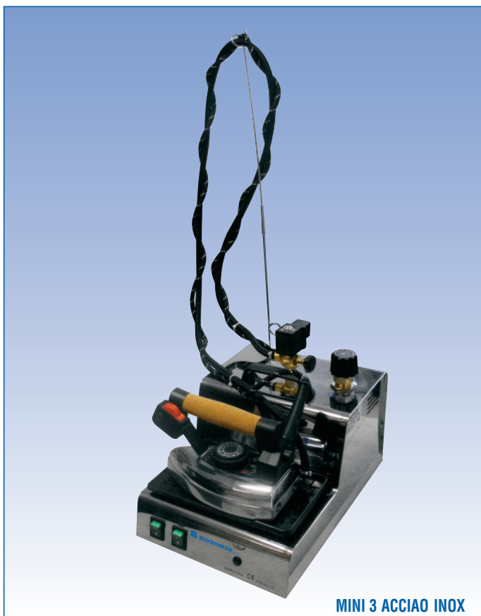
MINI 3 ACCIAIO INOX