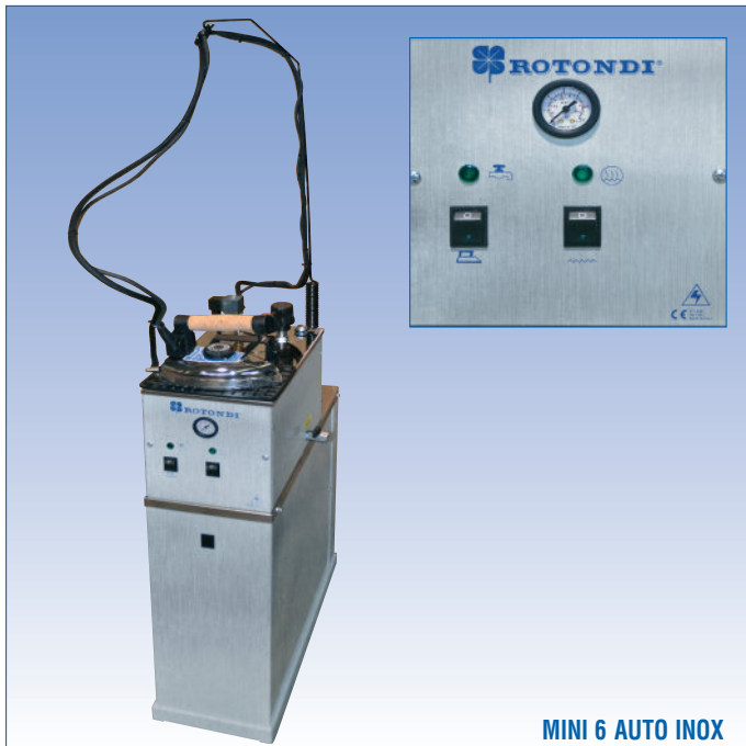
MINI 6 AUTO INOX

Generador de vapor con caldera de acero inoxidable, bomba de agua GRANDE a carga automática con control de nivel, estructura pintada de blanco en opción acero inoxidable. Control externo del nivel del agua, capacidad de agua 4 l, volumen de agua 5 l, resistencia 1700 W, presión de vapor 3 BAR, válvula de seguridad, doble termostato y termofusible de seguridad, plancha profesional EC-100-800 W. Depósito agua de 11 litros. Disponible 230/1/50-60